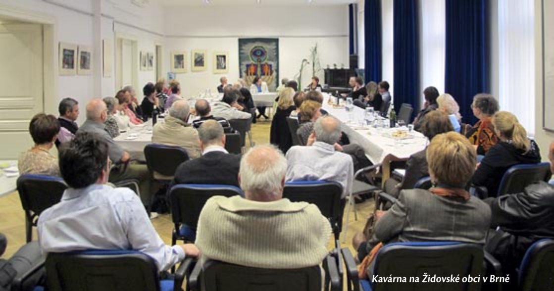
Kavárna na Židovské obci v Brně

lidech to je a nějak se s tím snaží vyrovnat. Mnohým pomáhá to, že o holocaustu se hodně mluví a píše, a proto se nemusí se svými pocity a obavami skrývat. I mně se zdá, že nejhůře na tom je generace druhá. Tito lidé vyrůstali v době komunismu, kdy židovské utrpení za války bylo do určité míry tabuizované. Také ne ve všech rodinách se toto téma probíralo otevřeně. Proto v sobě mají spoustu vnitřních traumat, která v sobě po mnoho let nosí, aniž by je řešili či sdíleli s někým dalším.