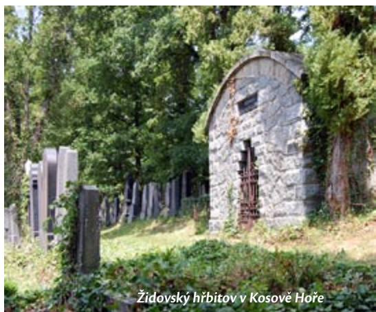
Židovský hřbitov v Kosově Hoře