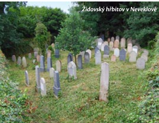
Židovský hřbitov v Neveklově