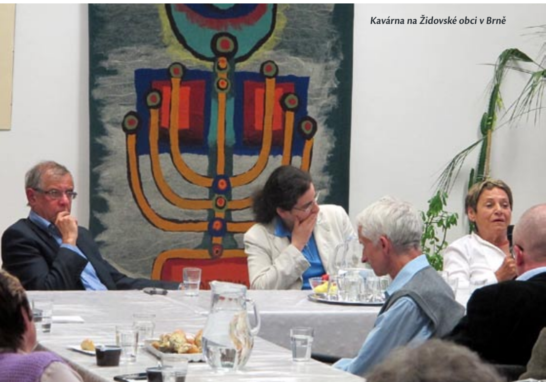
Kavárna na Židovské obci v Brně

● IK: Přes rozdílné příběhy jednotlivých hostů je velmi zajímavé pozorovat, že jednotlivé generace mají mnoho společného. Souhlasím s Honzou v tom, že s odkazem šoa jsou často vnitřně nejlépe vyrovnaní ti z první generace. Sami většinou říkají, že pokud chtěli začít žít normální život, tak jim zkrátka ani nic jiného nezbylo. Nejmladší generace často pořádně ani neumí vysvětlit proč, ale šoa se jí velmi bolestně dotýká. Mnozí se maličko stydí před těmi, kteří šoa zažili mluvit o svých traumatech, ale v těch