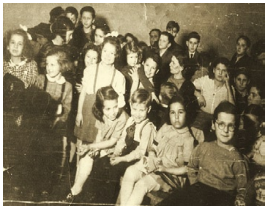
Oslava Chanuky v sirotčinci v roce 1947