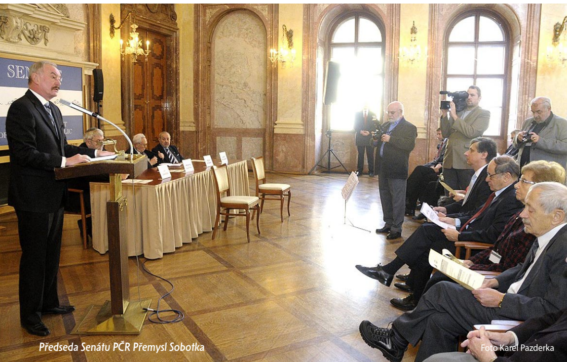
Předseda Senátu PČR Přemysl Sobotka