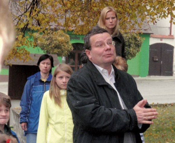
Slavnostního odhalení se mj. zúčastnil i Alexander Vondra.

Sychravé počasí ani připomínka smutných událostí našich dějin neodradila místní obyvatele a odhalení desek se v hojném počtu zúčastnili. Osud bývalých židovských sousedů jim není lhostejný. Snad se památníky stanou nejen trvalou připomínkou holocaustu, ale také mementem do budoucna.