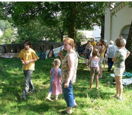
Výstava studentů rýmařovské ZUŠ

Dokumentaci židovské historie v Lošticích, Mohelnici a Úsově se zabývá sdružení Respekt a tolerance od roku 2003. Jeho členové předávají získané poznatky veřejnosti ve formě výstav, besed, článků, a také prostřednictvím vzdělávacích programů pro mládež. Informace o židovské historii v regionu prezentují na dlouhodobé výstavě v mohelnickém muzeu, loštické synagoze a muzejní části úsovské synagogy.