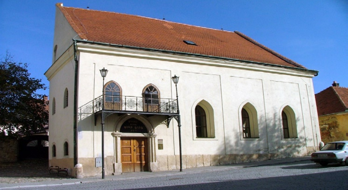
Nahoře synagoga v Boskovicích, na protější straně pohled do interiéru jičínské synagogy

se jedná o náročný projekt a tak za každou zajištěnou službou je nutno vidět celý tým odborníků.