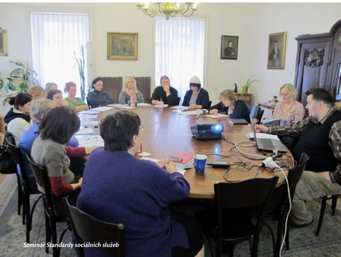
Seminář Standardy sociálních služeb

projektům realizovaným v roce 2013 již v polovině listopadu. K zářijové uzávěrce jsme obdrželi celkem 126 žádostí s požadavkem přes 21 milionů Kč. Nakonec byly uděleny granty v celkové výši 13 237 500 Kč.