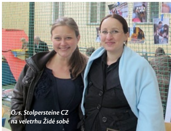
O. s. Stolpersteine CZ na veletrhu Židé sobě