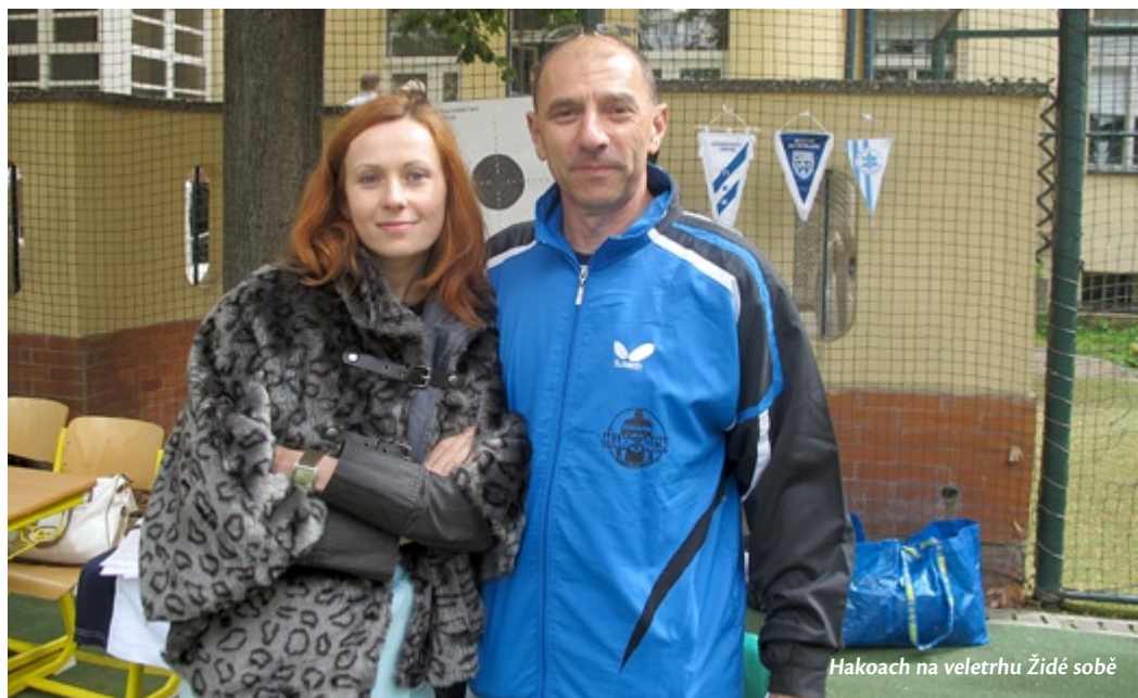
Hakoach na veletrhu Židé sobě

částkou 50 tisíc Kč. Jsme rádi, že jsme mohli pomoci v jejich nelehké životní situaci.