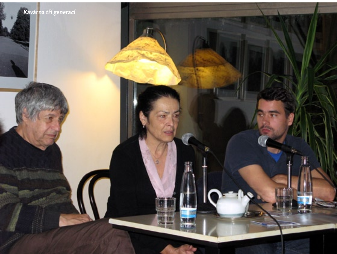
Kavárna tří generací